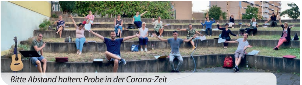
Bitte Abstand halten: Probe in der Corona-Zeit

Lampenfieber? Auch nach vielen Jahren gibt es keine Routine. „Lampenfieber ist eine Anspannung, die Energien freisetzt – auch fürs Publikum“, sagt Meier. Intensiv bereiten er und die bis zu 20 Sängerinnen und Sänger das große Jubiläumskonzert vor. Dort wird – anders als üblich – eine Band die UVC unterstützen. gs